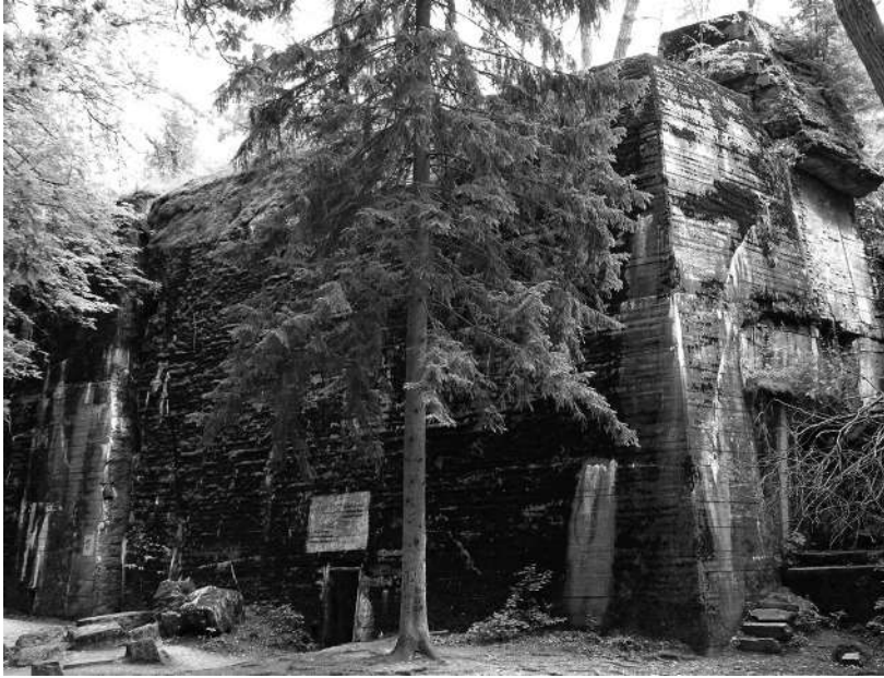
Fot. 5. Pozostałości bunkra Hitlera

tworzyli ci sami oportuniści i potakiwacze, ponosi współodpowiedzialność za to, że nawet rażąco błędne decyzje wojskowe dyktatora nie napotykały sprzeciwu 6 .