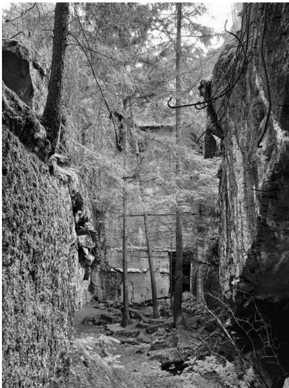
Fot. 4. Wejście do jednego z bunkrów

dziennika wojennego, w drugiej połowie 1944 roku pisał: „Tu nie padł jeszcze żaden ostry strzał, nie spadła ani jedna bomba, to dziwne pominięcie tego miejsca nieraz wydaje się człowiekowi trochę niesamowite”. Według niego w Wilczym Szańcu żyło się jak pod kloszem, a cierpienie ludzi na zewnątrz w najmniejszym stopniu nie obchodziło pracowników. „Nigdzie koniec wojny nie wydaje się tak odległy jak tutaj”. Niezmienny przez lata entourage Hitlera w ściśle odizolowanej kwaterze głównej, który przez lata