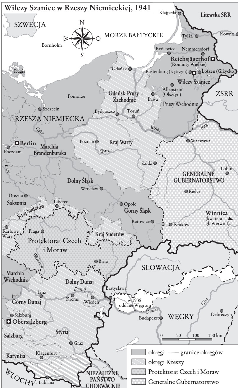
Mapa ukazująca położenie Wilczego Szańca na obszarze Rzeszy Niemieckiej, 1941 rok