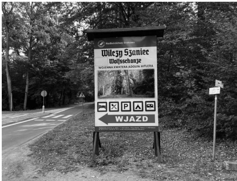
Fot. 1. Wjazd do Wilczego Szańca

Piaszczyste leśne dróżki, którymi szedłem od jeziora Siercze, ustępują miejsca pruskim brukowanym drogom. Idąc od południa, docieram do drogi krajowej, która do dziś przecina teren. Na południe od niej leżała II strefa zamknięta, zaś na północ – strefa I. Jeszcze zanim wybudowano Wilczy Szaniec, szosa łączyła Rastenburg z Angerburgiem (Węgorzewem), lecz w czasie wojny nie wolno było się po niej poruszać. Kwatera Główna Führera stanowiła obszar zamknięty. Dziś przy drodze mieści się wjazd do historycznego kompleksu i strefy I. Na dużej tablicy widnieje jego nazwa w języku polskim i niemieckim. Przechodzę przez jezdnię i mijam budkę z kasą i szlabanem, przed którym zatrzymują się autokary. W momencie publikacji tej książki wstęp kosztuje