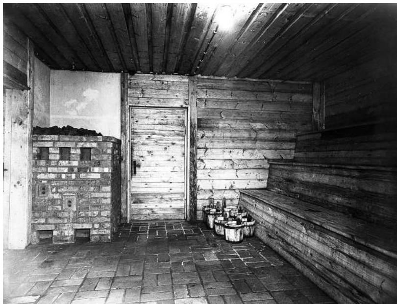
Fot. 6. Sauna dla mieszkańców II strefy zamkniętej

rozpoznaną przez Virilia „nazistowską klaustrofobię”, której przypisał winę za militarną klęskę Niemiec. Jego zdaniem druga wojna światowa była wojną komunikacyjną, w której decydujące znaczenie miały obrazy z radarów oraz nowe systemy lokalizacji i telekomunikacji. Natomiast doktryna obronna Hitlera, w której stawił na budowę sieci bunkrów, opierała się przede wszystkim na „litosferze, ziemi i krwi”. Mimo że reżim nazistowski prowadził operacje militarne z użyciem samolotów i U-Bootów i że jako pierwszy wykorzystał rakiety, to stratosfera i hydrosfera koniec końców pozostały mu obce. Porażkę Niemiec można też wyjaśnić „filozofią dowódcy wojennego, który jest związany z ziemią, z powierzchnią, [ta filozofia] jest wynikiem polityki